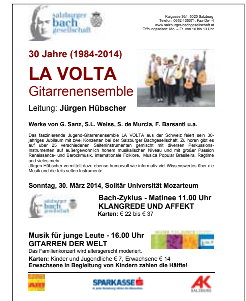
Flyer für zwei Konzerte in Salzburg