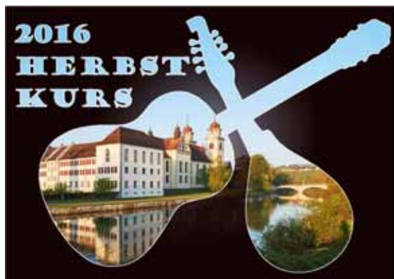
Bildgestaltung Sarah Frei