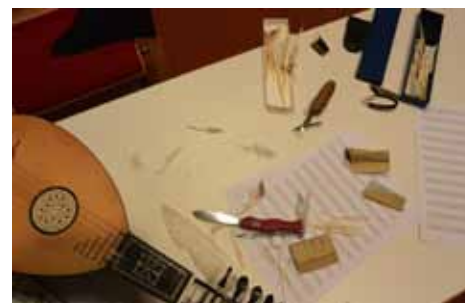
Das Handwerk neben dem Musizieren: Gänsefedern zuschneiden für die Barockmandoline

auch ein sehr spannendes Hörerlebnis in der Kombination ihrer Instrumente.