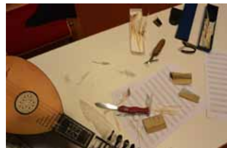
Das Handwerk neben dem Musizieren: Gänsefedern zuschneiden für die Barockmandoline

auch ein sehr spannendes Hörerlebnis in der Kombination ihrer Instrumente.